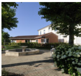
► QUATRE SITES UN HÔPITAL SAINTE ANNE