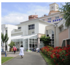
► QUATRE SITES UN HÔPITAL LAYNE