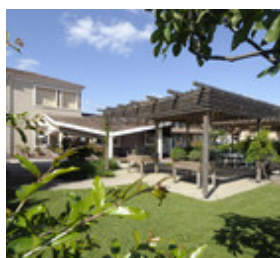
► QUATRE SITES UN HÔPITAL LESBAZEILLES