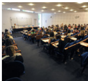
► DES LOCAUX ET ESPACES RÉNOVÉS Des locaux et espaces rénovés