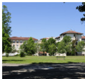
► QUATRE SITES UN HÔPITAL NOUVIELLE