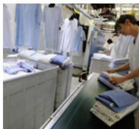
► DES PERSONNELS COMPÉTENTS ET À VOTRE ÉCOUTE Des personnels compétents et à votre écoute